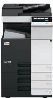
ineo+ 308 mit Dual Scan Original-einzug (DF-704), Ausgabefach (OT-506) und Papiereinzug (PC-210)

Wenn Sie in eine ineo+ 308 investieren, sind Sie in Bezug auf Spezialaufgaben, wie z. B. auf hochwertigem Karton gedruckte Einladungen, nicht mehr von externen Dienstleistern abhängig. Dadurch sparen Sie Zeit und Geld. Mit der ineo+ 308 können Umschläge, Recyclingpapier, vorbedrucktes Papier, OHP-Folien, viele andere Medien und selbst Karton bis zu einem Papiergewicht von 300 g/m 2 bearbeitet werden. Diese Systeme können zahlreiche Papierformate, von A6 bis A3+ (SRA3), sowie benutzerdefinierte Formate und Banner bis zu einer Länge von 1,2 Metern bedrucken. Außerdem ermöglichen die vielfältigen Endbearbeitungsoptionen das Erstellen bis zu 80-seitiger Broschüren, verschiedene Arten des Brieffaltens, das Heften von Handouts oder Lochen von Rechnungen. Mit einer ineo+ 308 kann fast jeder Druckauftrag intern bearbeitet werden.